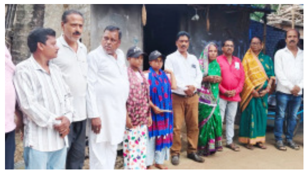
ପାଠ ପଢିବା ଓ ଦୂରର କଥା ବାପାଙ୍କ ଶୁଣିକିମ୍ପା ପାଇଁ ଗ୍ରାମରୁ ଭିକ୍ଷା ମାଗିବା ଘଟଣା ଚର୍ଚ୍ଚାର ପରିସରକୁ ଆସିଥିଲା । ଉକ୍ତ ଘଟଣାଟି ପ୍ରଚାରିତ ହେବା